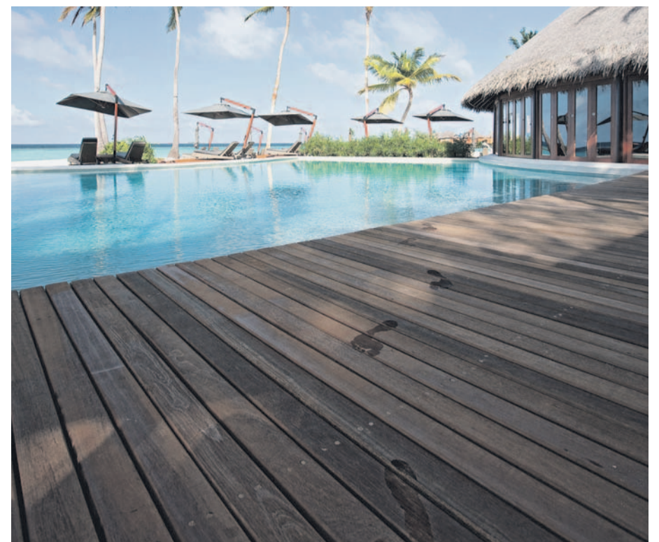
Spurensuche: Die meisten Gäste sind scheu und gehen sich aus dem Weg.

mich durch das Loch anglotzen könnte. Da trifft mein Foltermeister einen Nerv. Schmerz, denke ich, unendlicher Schmerz. Dann höre ich jenseits meiner schreienden Seele ein Stimmchen: „Don't worry, Sir. Be happy!“