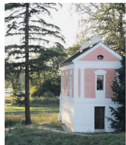
Kleindorf: Das rosa Kunstwerk schimmert durch das satte Grün des Gartenreiches.

Was tut man an solchen Tagen? Nur das Angenehmste. Auf dem Elbwall kann man mit Rädern durchs Biosphärenreservat Mittelbebe gondeln, das unter Unesco-Kulturerbeschutz steht wie auch das Gartenreich. Dort hinein geht es nur zu Fuß, stundenlang über Hängebrücken und mit historischen Fahren über Seen und Kanäle oder mit