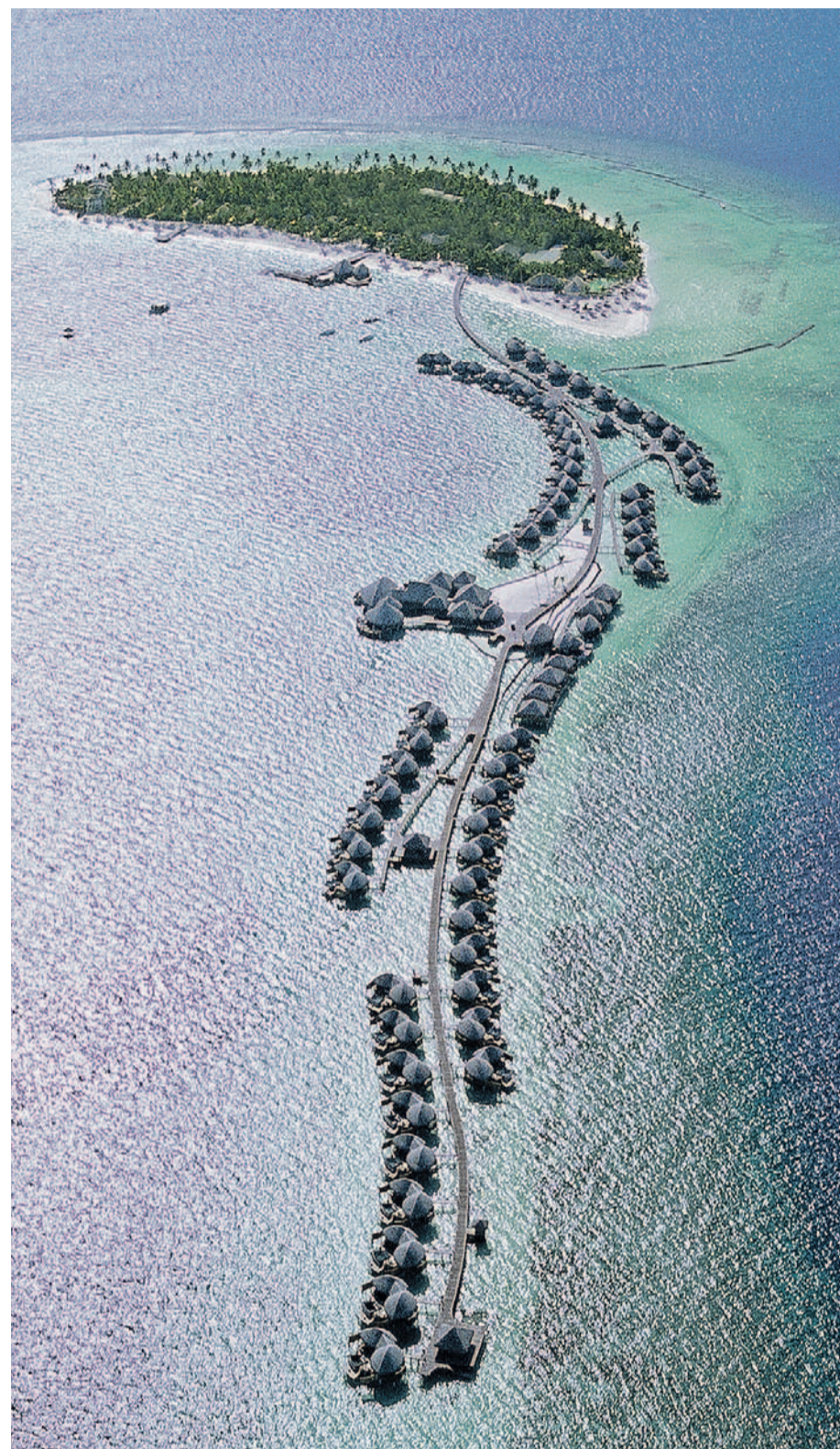
Beengtes Eiland: Jede Wasservilla ist auf Halaveli mühsam dem Meer abgetrotzt.